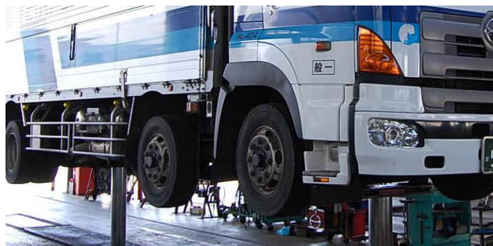
■ ■ 車検・定期点検

道路車両運送法に基づき 安全・安心を心がけ、車検整備、定期点検を行っております。また特装車の年次点検、特定自主検査なども実施しております。