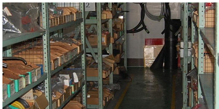
■ ■ 部品販売