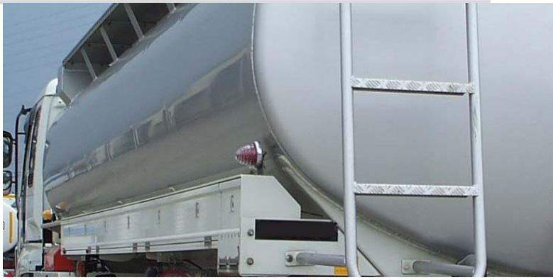
■ ■ 特装車の架装・改造

特装車には、粉粒体運搬車やタンクローリー、クレーン等多くの種類があります。シャシ交換に伴う架装物の乗替、新車導入に伴う構造変更、ボデー架装物の架装など長年培ったノウハウと架装メーカ指定サービス工場の確かな技術でお客様のご要望に合った提案をいたします。