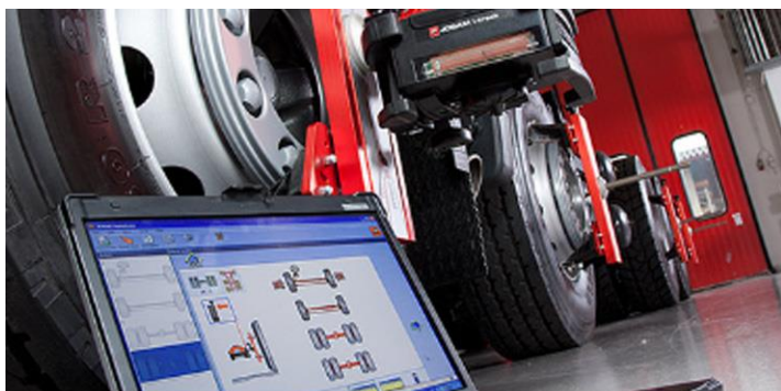
■ ■ アライメント整備