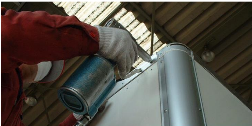
■ ■ 新車ボデー架装

ボデー製作、特殊ボデーの製作、アルミバンのボデー架装、パワーゲート、クレーン架装などを行っております。品質を第一により製品作りに努めております。