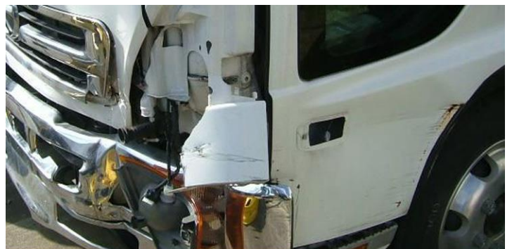
■ ■ 事故車の整備

ヨーロッパ（JOSAM社）の技術を取り入れ、事故車を復元するノウハウにより、より早く正確で、確かな技術で、軽度な事故からフレーム、ボデーまでの大破な事故車まで早く正確に修理させていただきます。